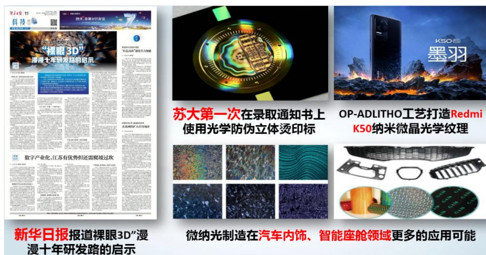
图 8 学院重大科技成果转化

“裸眼 3D” 漫漫十年研发路的启示的专题报道肯定了学院十年来在裸眼 3D 显示技术领域的关键技术突破。这些成果应用彰显了学院以服务国家重大战略和社会经济发展需求为导向，科技成果转化能力进一步提升（图 8）。同时学院充分利用已孵化上市 2 家光学公司（苏大维格、苏大明世）的完整产学研链条，以及 2018 年与地方政府（苏州市和苏州工业园区）合作共建的“新型研发机构”（苏州中为柔性光电子智能制造研究院有限公司）所提供的优质微纳柔性光电子研发平台，在为区域和地方经济及产业升级提供服务同时，研究生在高新技术研发与科研成果转化中进一步提升科研创新和实践能力，使其既可仰望星空、更能脚踏实地，“真求知”、“求真知”，进而实现优秀成果转化反推学术发展，激发科研热情。