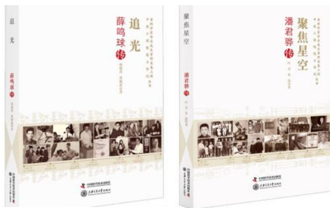
图 4 两位院士科学家传记走进课堂

不断完善本专业课程体系。 2022年，学院结合光学工程一级学科学术型研究生培养方案实施一年的工作实际，经学院学位评定分委员会专家审议，对光学工程学术型研究生培养方案进行了相应修订，一方面为使本专业研究生能集中、高效地完成专业课程的学习，确保留有充裕的时间完成研究生阶段科研成果的发布和学位论文的完成，将信息光学、Fundamentals of Photonics、Microwave Fundamentals and Applications、半导体激光器四门课程从春季开课调整到秋季开课，另一方面为使本专业研究生更进一步了解掌握光电探测器的工作原理、性能特点和相关应用，学院新开设学位选修课《光电探测技术》。