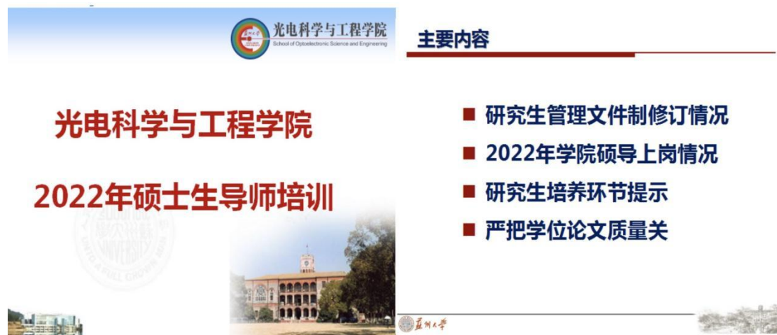
图5 学院开展硕士生导师上岗前培训

同时学院于2022年5月20日以腾讯会议在线形式组织所有研究生导师进行了专场的上岗前培训（图5），培训围绕学校研究生管理相关政策文件的修订更新情况、学院当年研究生导师上岗整体情况、研究生各培养环节的工作要求、研究生学位论文的质量要求等方面和学院导师们做了汇报和交流；同时对实验室日常管理规范和安全注意事项，如何构建和谐师生关系给出了一些建议。学院希望参会教师都能履行好研究生导师立德树人的重要职责，切实落实好研究生各个培养环节，严把研究生培养质量关，不断提高学院高水平人才培养质量，为学院学科长远发展贡献力量。