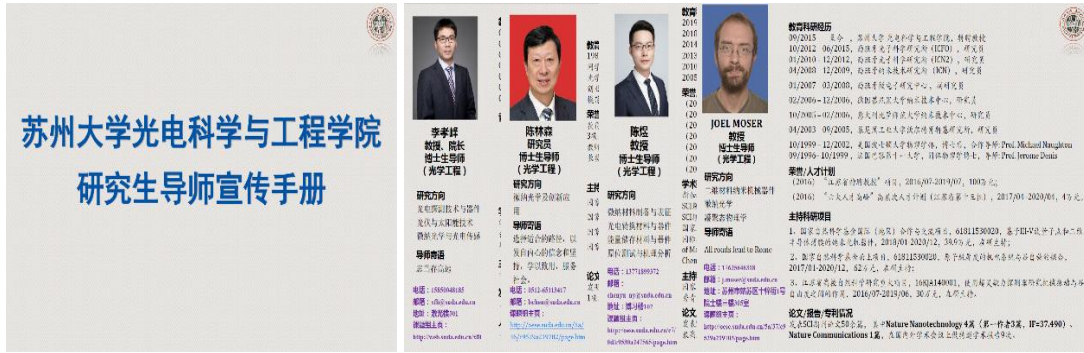
图 3 学院研究生导师宣传手册