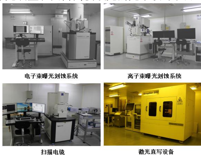
图 2 学院部分大型仪器设备

近五年，依托所属光学工程作为省重点学科和优势学科、微纳协同创新中心项目建设，现有仪器设备原值达 2.2 亿元，购置了种类齐全、性能先进的仪器设备（图 2），实验室总面积超过 1.2 万平方米，其中 5000 平米为千级超净实验室，拥有国内最大全息光学平台、最大口径全息曝光装置和国内高校领先的光学设计和加工检测实验室。